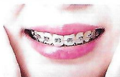
un appareil dentaire