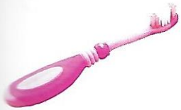
une brosse à dents